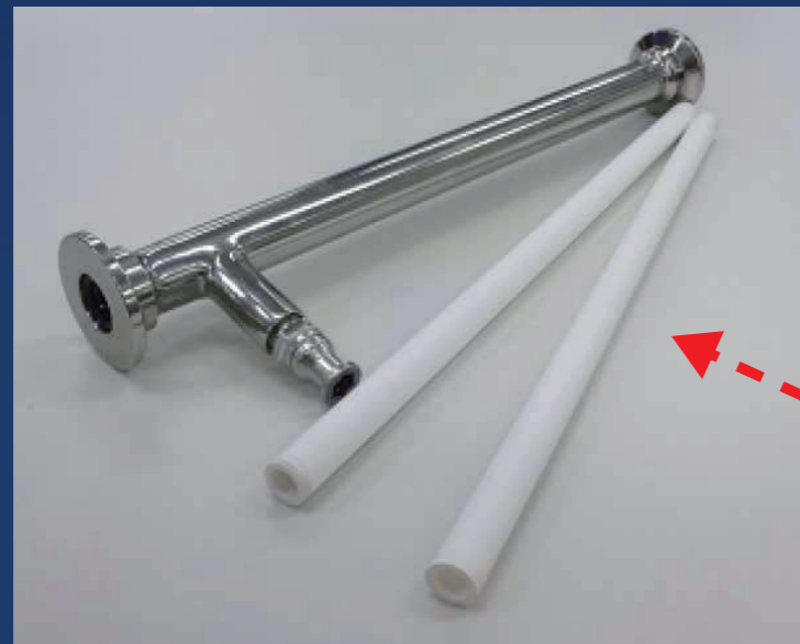
セラミック膜とハウジング